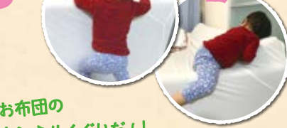
「お布団のトンネルくぐりだ!」 「上手に登れたよ!」