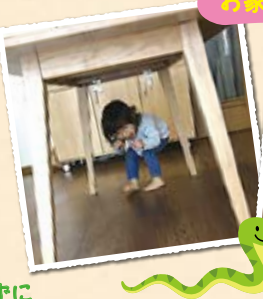
「へびさんの目線はこんなかな?」 「椅子とテーブルの間を上手に進むぞ~」