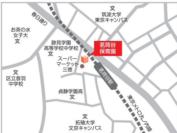
東京メトロ丸の内線「茗荷谷」駅 徒歩1分